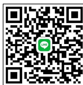
สแกนเข้ากลุ่มไลน์

๔. เอกสารและหลักฐานที่ผู้สมัครสอบจะต้องนำมายืนยันในวันสมัครสอบ ฉบับจริงพร้อมสำเนาจำนวน ๑ ฉบับ ดังนี้